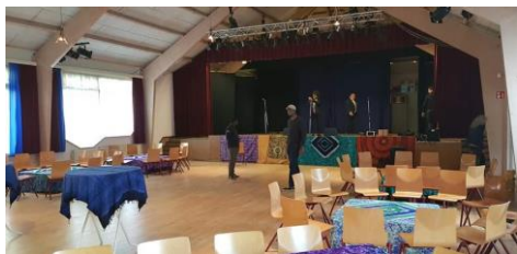
Met Lamine Diatta en Ibrahim Diassy was de zaal om 18.00 uur ingericht.