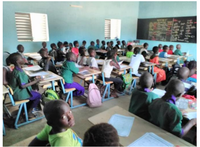
Nu al overvol: 80 kinderen in de 1 e en 2 e klas.